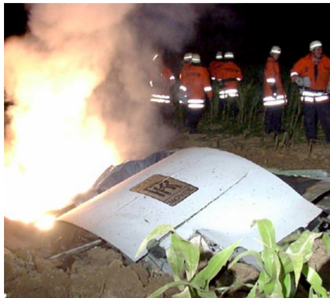
Es werden Wrackteile am Boden im Umkreis von 30 Kilometern vermutet.

Trotz mehrfacher Aufforderung habe der Pilot aber nicht reagiert. Die DHL-Boeing habe auszuweichen versucht, dabei sei es zum Zusammenstoss gekommen. Für den Flugraum über der Absturzstelle ist nicht die deutsche Flugsicherung zuständig, sondern die Schweizer Skyguide.