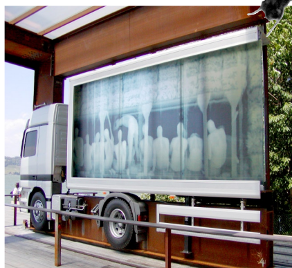
Die mobilen Portale

In unmittelbarer Nachbarschaft der Ausstellung der Sanität bei der Werft befindet sich diese Ausstellung des Bundes. Die grösstenteils mobile, sich stetig wandelnde Ausstellung thematisiert die „Sicherheit in der Offenheit“ und soll zum Nachdenken über die institutionelle Offenheit unseres Landes anregen.