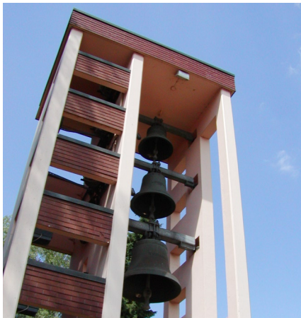
Glockenturm von Müntschemier